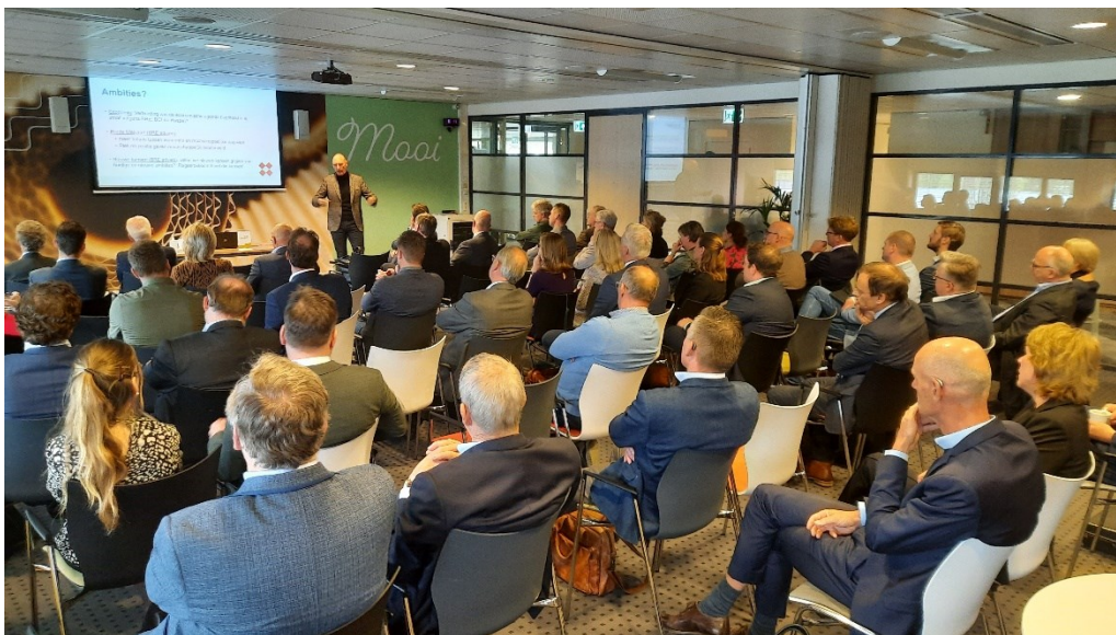
Bestuurders op de Regiodag in maart 2022.