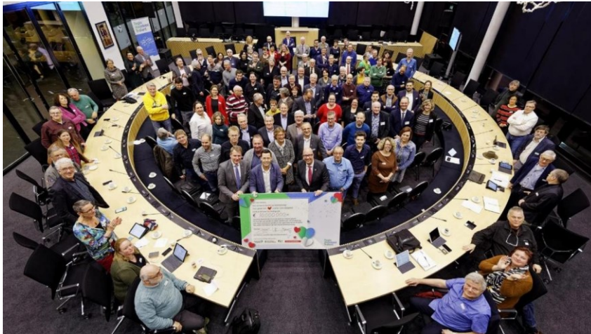
Raadsleden en bestuurders 'vieren' Regio Deal.

De Regio Deal is ook een belangrijke aanjager geweest van een betere samenwerking met provincie en Rijk op andere opgaven. Zoals bijvoorbeeld de verstedelijkingstrategie (met provincie en ministerie BZK), de mobiliteitsopgave (met provincie en ministerie I&W) en het programma landelijk gebied (met provincie en ministerie LNV).