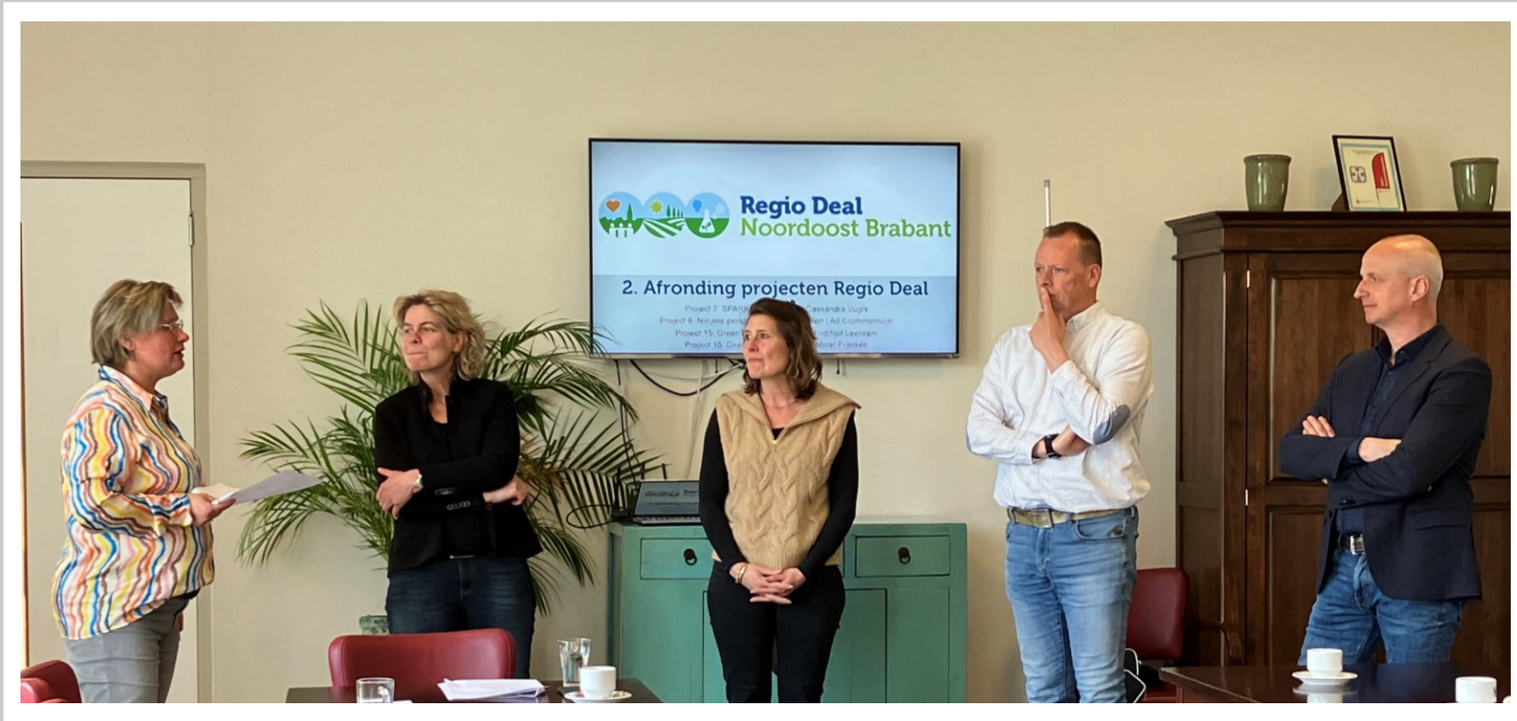
Projectleidersbijeenkomst Regio Deal met enkele projectleiders van afrondende projecten