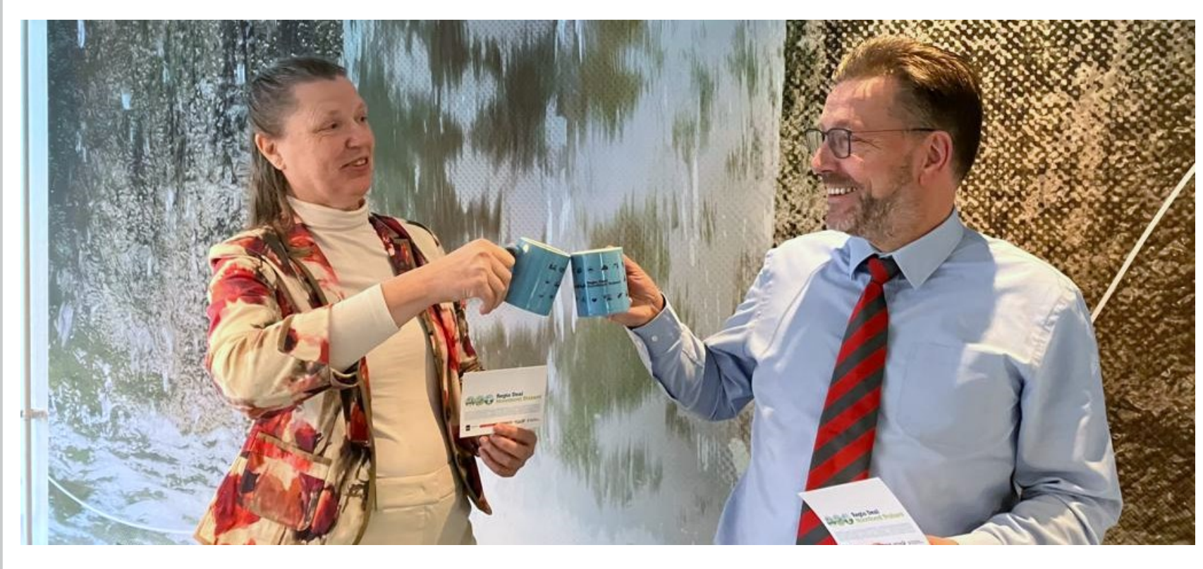
Eindgesprek met de projectleider en de bestuurlijke trekker (project 4. Inzet data voor vitale voorzieningen)