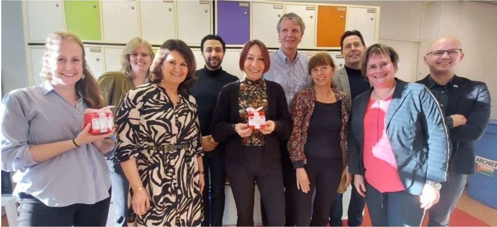
Bezoek aan programmateam Regio Deal Den Haag Zuid-West