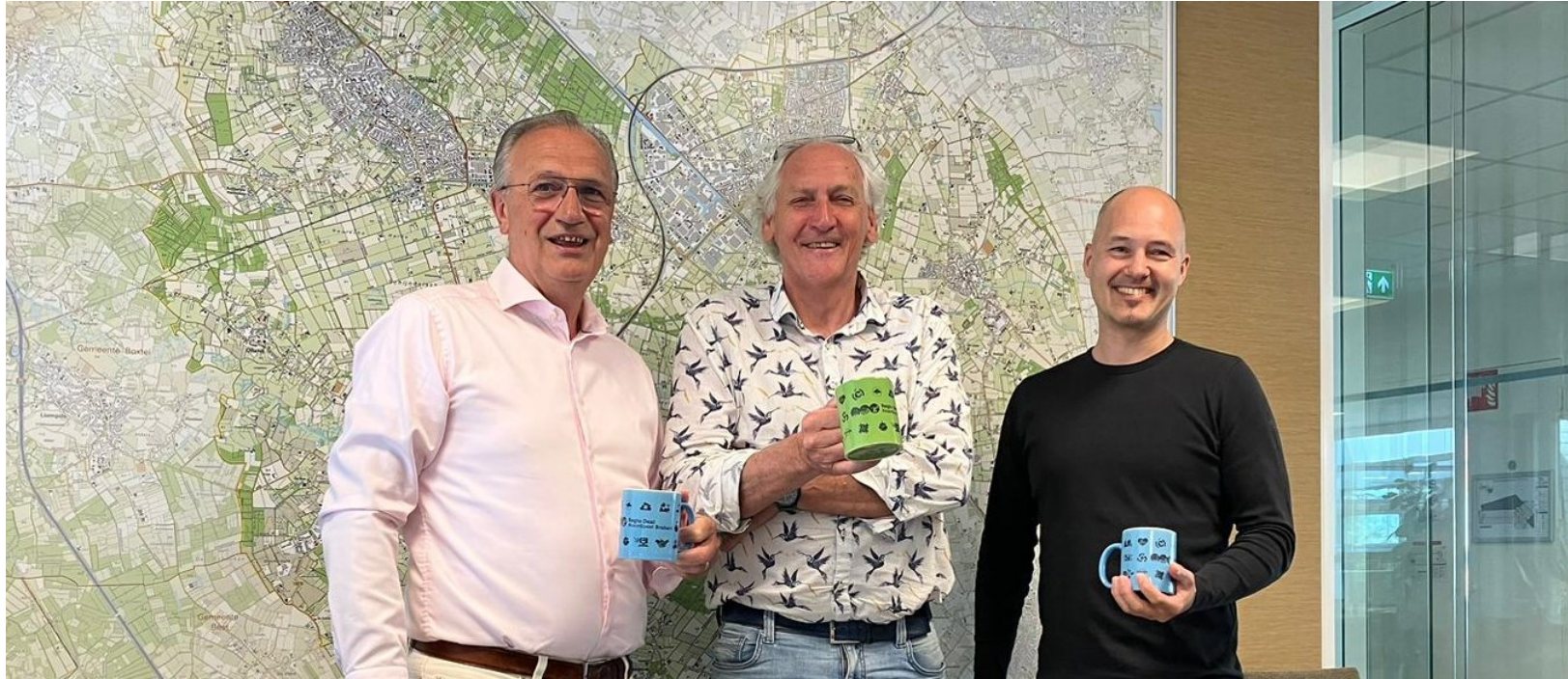
Eindgesprek met bestuurlijke trekker, projectleider en penvoerder (3. Voorzieningen voor internationale werknemers)