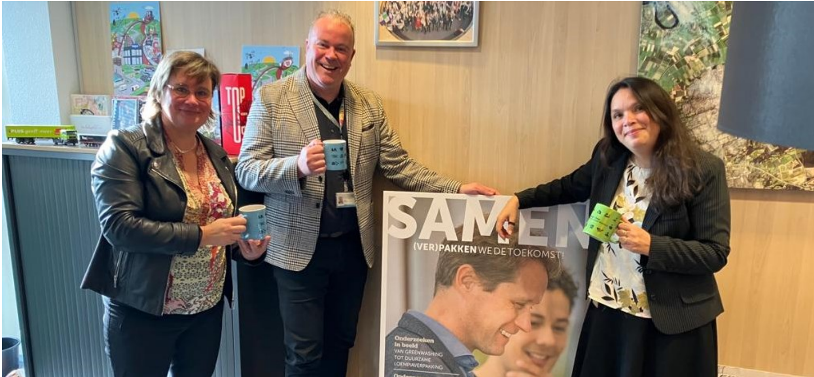
Eindgesprek met bestuurlijke trekker en projectleider (14. Circular Food Center: Duurzaam verpakken)