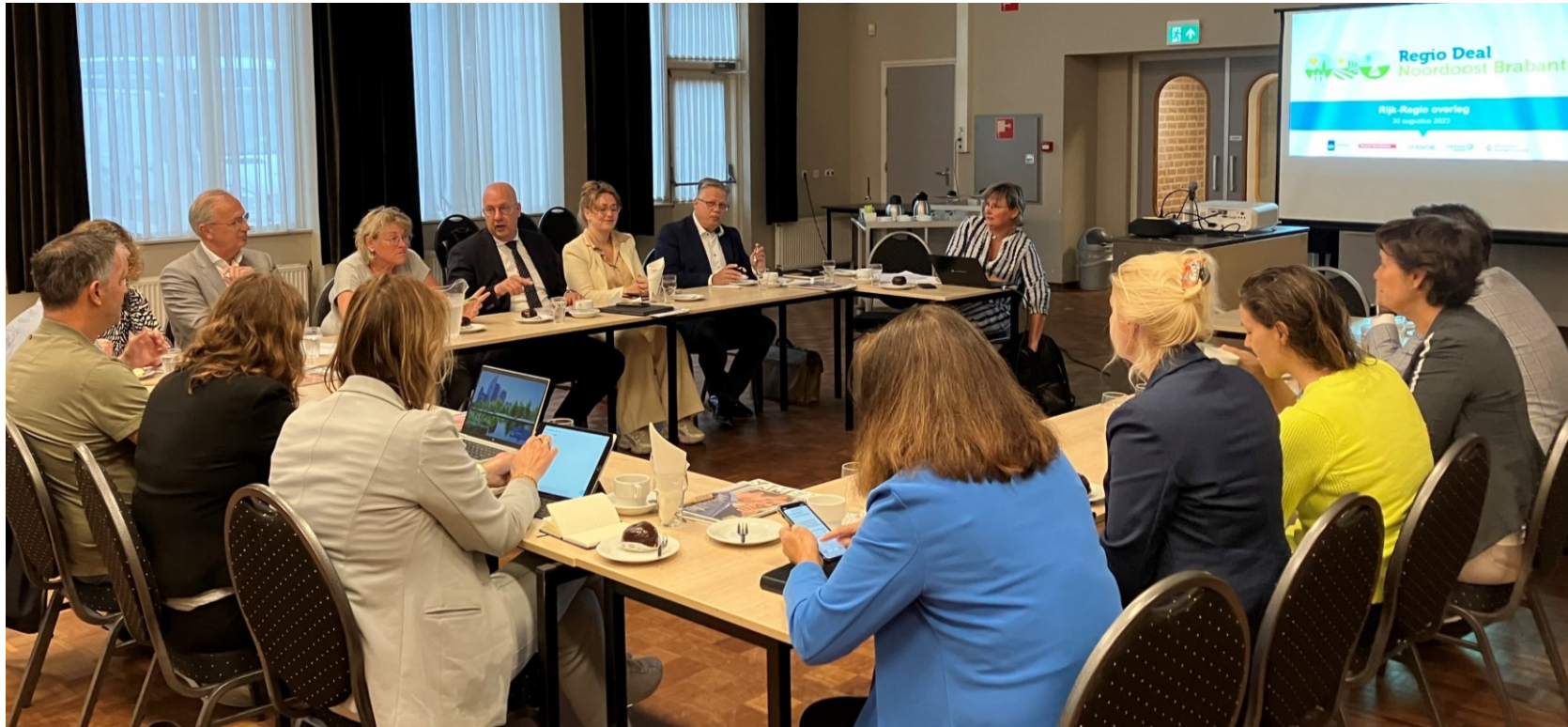
Het jaarlijkse Rijk-Regio overleg met departementen en DB+ over de voortgang van de Regio Deal