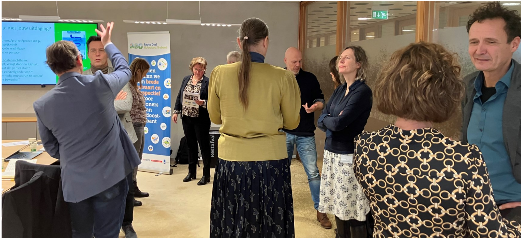
Botsproeven met de projectleiders van de Regio Deal (project 9. Puzzelen met ruimte)