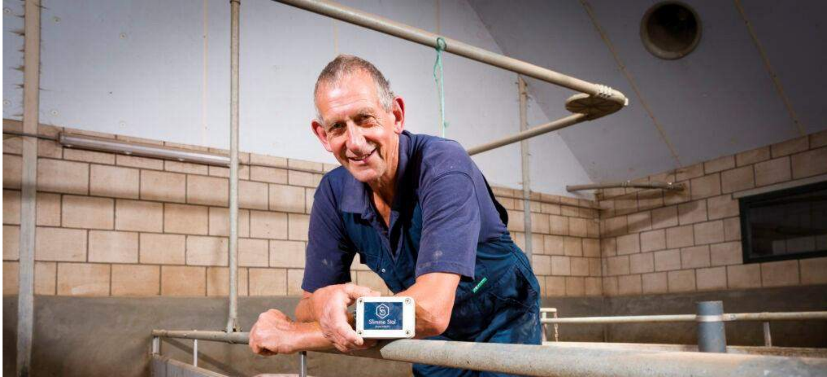
Project: AgriFood Innovation - Slimme Varkensketen