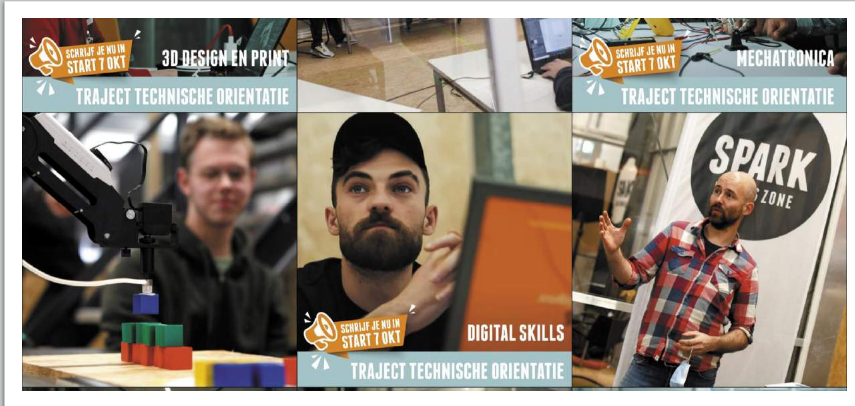
Project: SPARK Makers Zone