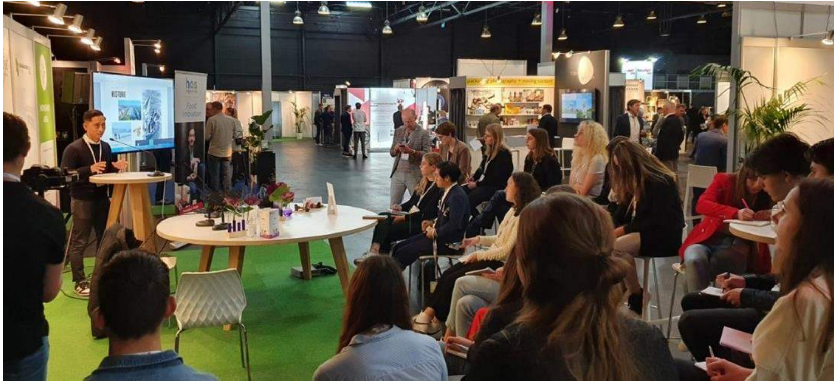
Project: Circular Food Center - Innovatieprogramma circulaire verpakkingen met HAS-studenten en ondernemer