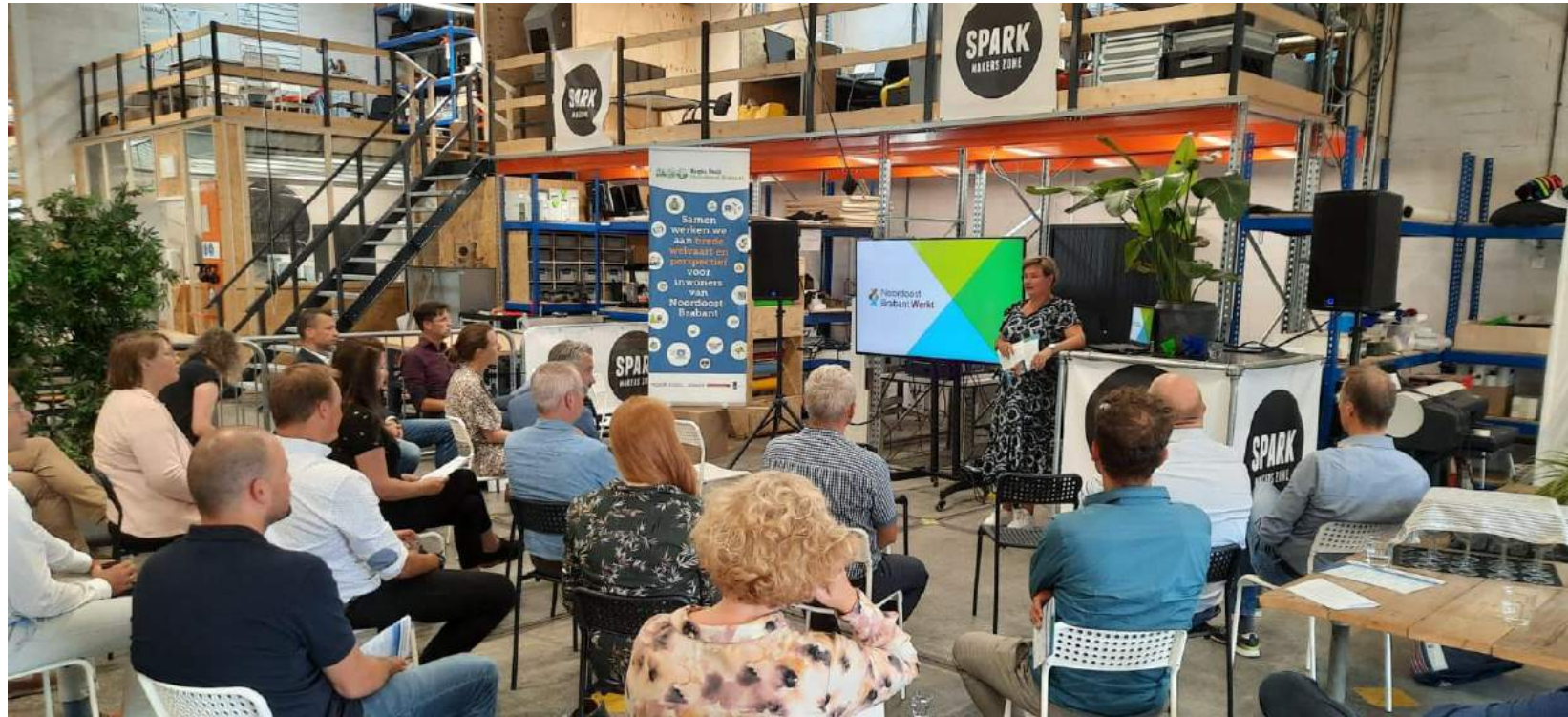
Bijeenkomst projectleiders Regio Deal en gemeentelijke accountmanagers bedrijven bij project SPARK Makers Zone