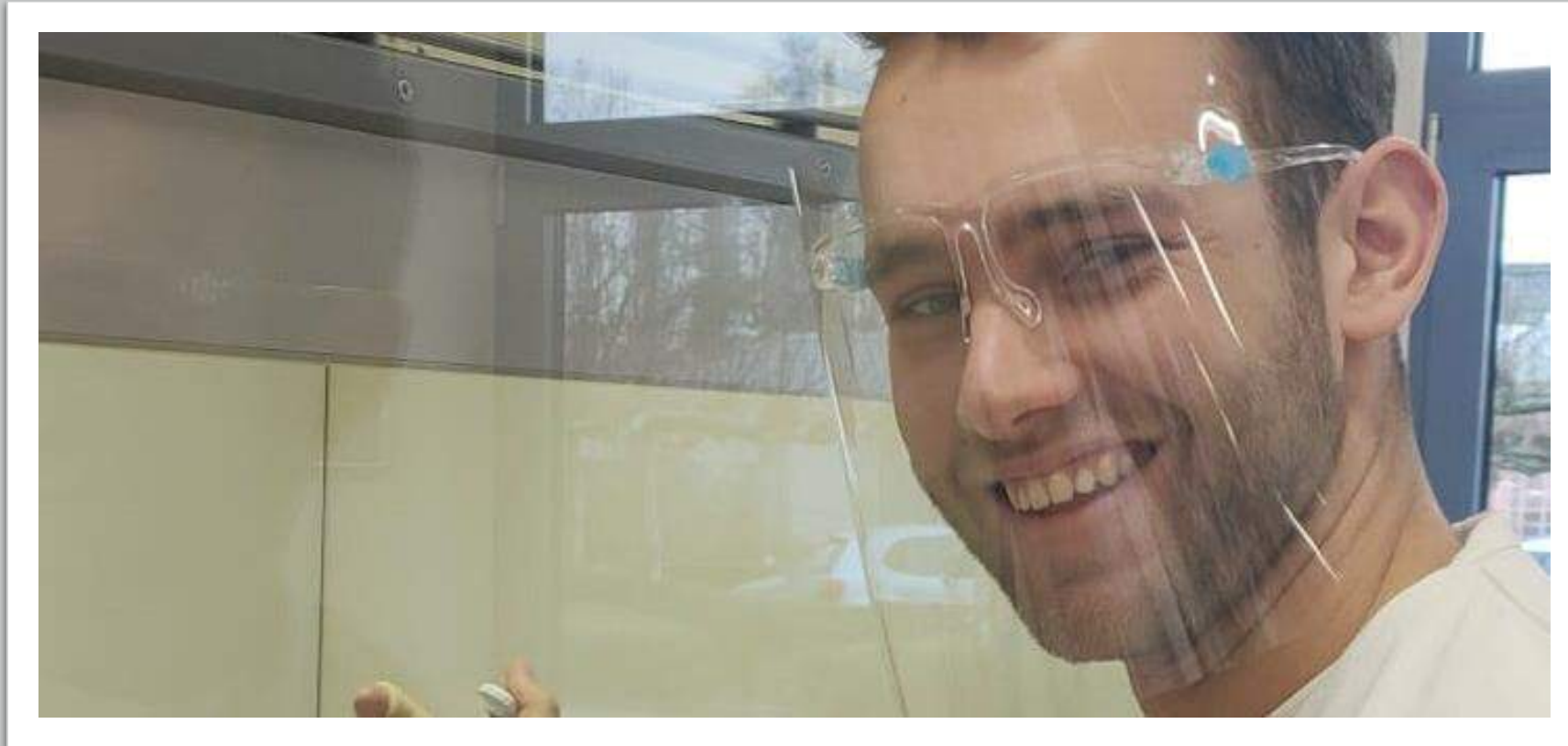
Project: Direct energie uit mest - HAS-student aan het werk